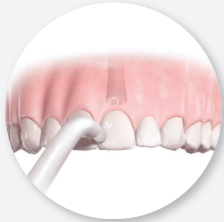
2. Winkelbürste mit Borstenbündel