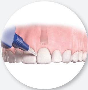
3. Interdentalebürste (Zwischenraumbürste)