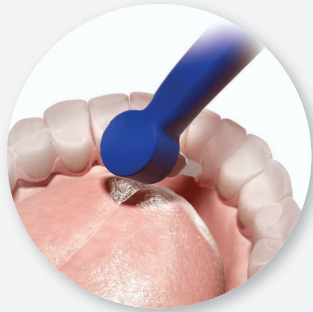
2. Winkelbürste mit Borstenbündel