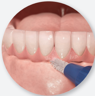
3. Interdentälbürste (Zwischenraumbürste)